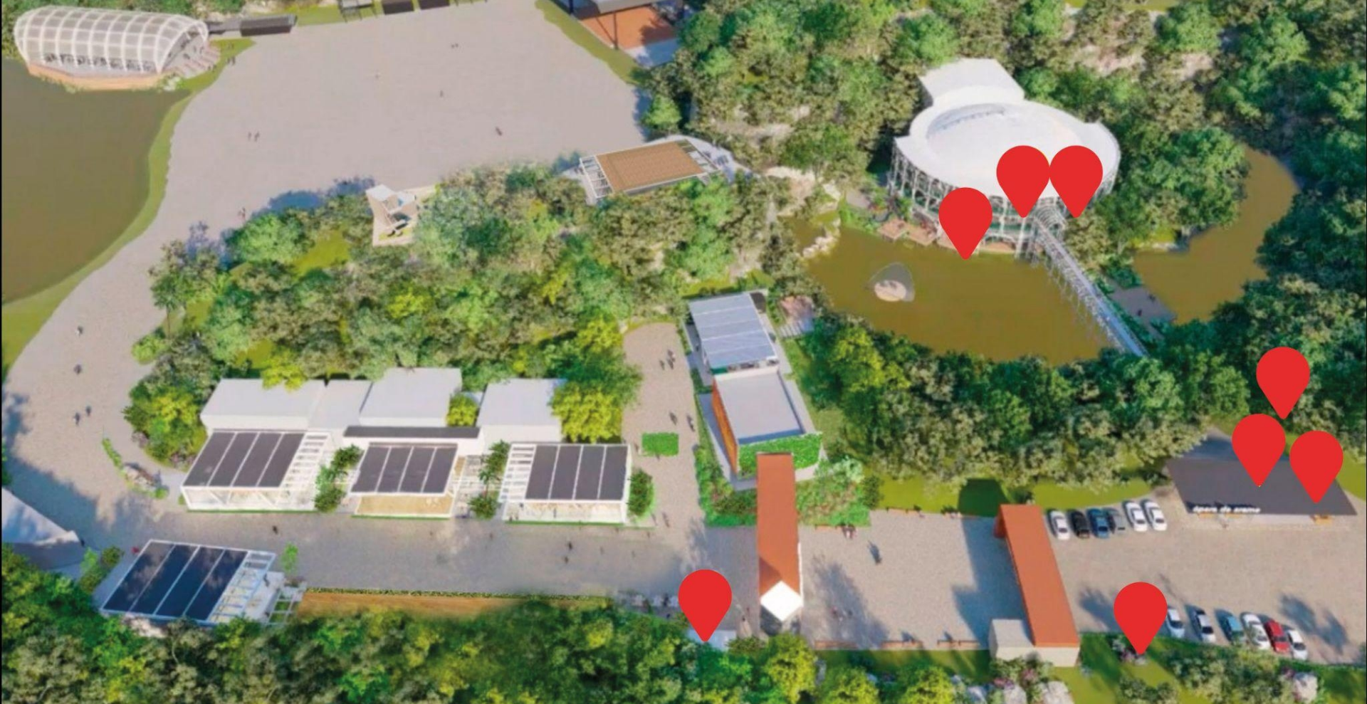
Localização dos Painéis de LED 00H no Parque Jaime Lerner