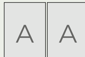
Página dupla 42xm x 31cm

Anúncios nas extensões pdf, jpg ou tiff. 300 dpi Margem de segurança com 1 cm de sangra.